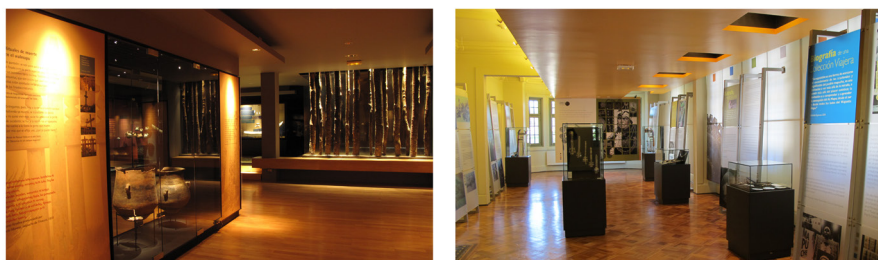
Figura 6. Aspecto de las dos salas de exposición del Museo Regional de la Araucanía tras la remodelación del inmueble: a la izquierda, el espacio dedicado a la muestra permanente, en el subterráneo; a la derecha, la muestra temporal, alojada en el primer piso.

La remodelación abarcó el edificio, la cochera y el parque, potenciando asimismo las áreas exteriores y los accesos. Siguiendo fielmente el diseño original, se cambiaron todas las ventanas, revestimientos interiores de muros y entablados de piso, al igual que la cubierta exterior, que se reemplazó y pintó. Se aumentó también la altura del subterráneo y se lo protegió de filtraciones, recuperándose dicho espacio como sala de exposiciones permanentes (fig. 6).