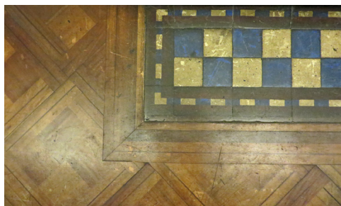
Figura 4. Detalle de los pavimentos originales del primer piso, de parquet importado desde Europa.

Complementaba el conjunto una cochera con acceso de carruajes desde el callejón Thiers, hoy llamado «pasaje El Bosque». Igual que la casa, dicha estructura –hoy sala de conferencias– estaba construida en madera con frontis enchapado en estuco, mientras que las fachadas laterales estaban revestidas con entablado de madera (fig. 5).