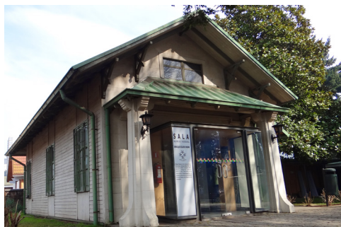
Figura 5. Vista de la cochera, donde actualmente se ubica la Sala Audiovisual Enrique Eilers, 2017.