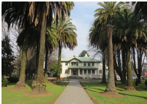
Figura 3. Vista del frontis de la casa Thiers desde el acceso de avenida Alemania, flanqueado por ejemplares centenarios de palmeras Phoenix , 2017.

cubiertas de grandes pendientes, con importante presencia de lucarnas y mirillas.