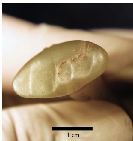
Figura 5. Huellas de uso marcadas en la cara interna de la base de un tembetá cilíndrico curvo. Museo Chileno de Arte Precolombino, Colección Durruty, n.º inv. MAS-1389A.

Otro aspecto interesante de analizar en los tembetás es su dimensión de uso. Hasta aquí, investigaciones en restos bioantropológicos del PAT habían identificado la existencia de huellas asociadas a la utilización de estos artefactos en las mandíbulas inferiores y dientes de algunos individuos (Quevedo, 1982; Torres-Rouff, 2010). Los últimos estudios efectuados sobre tembetás del NSA, sin embargo, han detectado marcas atribuibles al roce constante en las piezas mismas (fig. 5), algunas tan tenues que resultan apenas perceptibles y otras de extensión y profundidad considerables (González, 2018a).