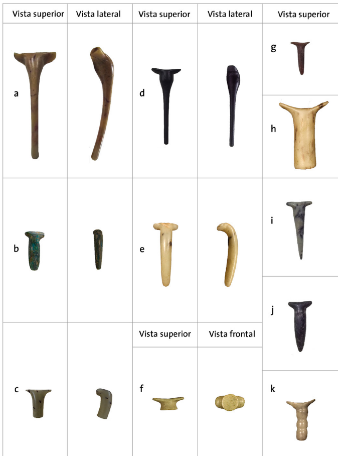
Figura 3. Tipología de tembetás del Norte Semiárido: (a) botellita curvo; (b) plano; (c) cilíndrico curvo; (d) botellita recto; (e) cilíndrico aguzado curvo; (f) discoidal con alas; (g) cilíndrico aguzado recto; (h) cilíndrico recto; (i) cónico; (j) fusiforme; (k) lobulado.

Los tembetás del valle del Elqui, en tanto, acusan cierta inclinación por las formas, tamaños y decoraciones que se observan en Atacama, aunque también integran expresiones características de los valles centrales del NSA. Lo mismo se aprecia en los sitios arqueológicos Molle ubicados en el interfluvio Huasco-Elqui, cuyos tembetás se asemejan bastante a los del valle elquino (González, 2018a).