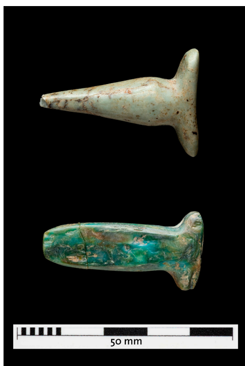
Figura 7. Dos tembetás líticos del sitio Los Molles, Rapel: arriba, ejemplar del tipo botellita recto; abajo, ejemplar plano, probablemente de crisocola. Museo del Limarí, Colección Arqueológica, n.º inv. 00781b y 00783c.

Dentro de los tipos generales representados en la colección se encuentran los tembetás de botellita, una de las formas más clásicas registradas en el NSA. Se caracterizan por poseer un cuerpo recto o curvo perpendicular a la base y una sección proximal de forma cónica («botellita») cuyo espesor disminuye hacia la parte distal, la cual presenta un grosor regular desde el término de la botellita hasta la punta misma del tembetá (González, 2018a). Llama la atención que los ejemplares de este tipo que conserva el Museo provienen