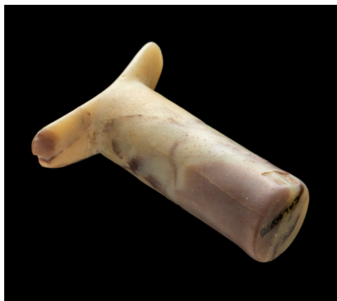
Figura 1. Tembetá lítico del tipo cilíndrico recto procedente del sitio Planta Lechera, Ovalle. Museo del Limarí, Colección Estadio Fiscal de Ovalle, n.º inv. 778.

De acuerdo con el paradigma neolítico que por décadas dominó la arqueología en la zona, hasta los años '90 se consideró que la aparición de la cerámica en el NSA suponía la consolidación