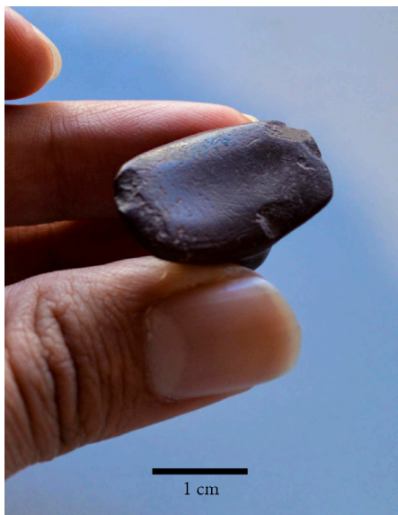
Figura 8. Detalle de probables huellas de uso en la cara interna de la base de un tembetá lítico discoidal con alas. Sitio de procedencia no identificado. Museo del Limarí, Colección Arqueológica, n.º inv. 894.

Tal como se describió para otras piezas del NSA en González (2018a), dentro de la colección del Museo del Limarí se detectaron 4 tembetás con probables huellas de uso en la cara interna de la base, las que van desde pequeñas depresiones pareadas hasta hundimientos más extensos y marcados (fig. 8). Considerando que la dureza de las piezas supera considerablemente la de las partes del rostro con las que tenían contacto, la presencia de tales marcas demostraría una utilización muy prolongada e intensiva de estos tembetás, probablemente por más tiempo del atribuible a un único usuario –dicho de otro modo, es posible que hayan sido transferidos o heredados de un sujeto a otro–. Con ello, también resulta plausible pensar que una misma persona pudo emplear más de un tembetá a lo largo de su vida, como parte de procesos de dilatación labial paulatina (González 2018a) y –por qué no– en función de determinados contextos sociales a los cuales el tembetá estaba asociado.