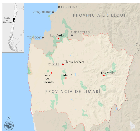
Figura 6. Distribución geográfica de los sitios arqueológicos de donde proceden los tembetás de la colección del Museo del Limarí. Elaboración propia.

La colección del Museo del Limarí consta de 21 tembetás líticos en distintos estados de completitud, todos provenientes de sitios arqueológicos de la cuenca del Limarí y sus afluentes, y de quebradas cercanas. Si bien se conoce la procedencia específica de la mayoría de ellos (fig. 6), su información contextual es bastante pobre, lo que se explica por tratarse de hallazgos fortuitos y donaciones de particulares (Pérez, 2018).