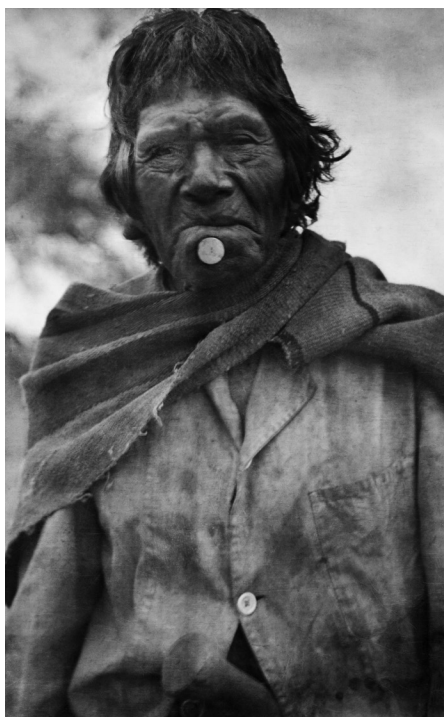
Figura 2. Erland Nordenskiöld. «Anciano chiriguano con gran botón labial. Tihuiipa», 1908. Registro fotográfico de la expedición sueca de Hernmarck (1908-1909) a Argentina y Bolivia.